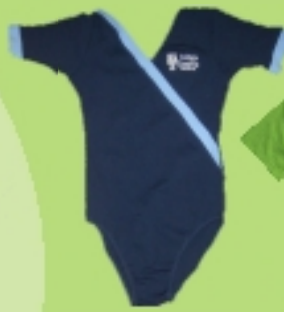
COLANT PARA DANÇA