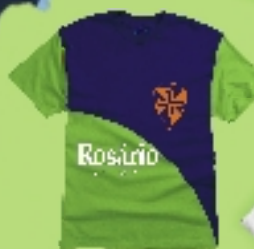
CAMISETA PARA ATIVIDADES EXTRACURRICULARES